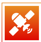
GPS / Glonass / Galileo