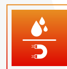
IP67 / Aimanté